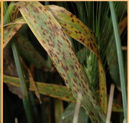
F. sp teres , moteado en red