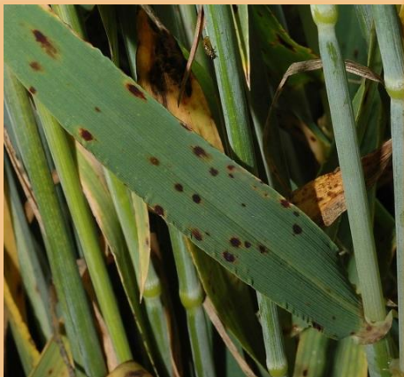
F. sp maculata , manchas punteadas