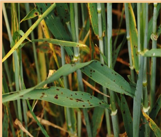
Inicio de síntomas en hoja bandera