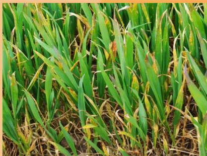
Rodal afectado inicial