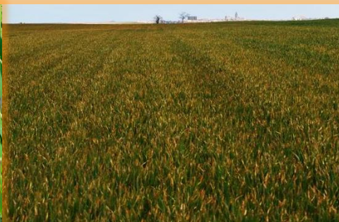
Aspecto general estado avanzado