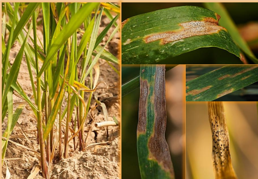
Clorosis amarillenta inicial